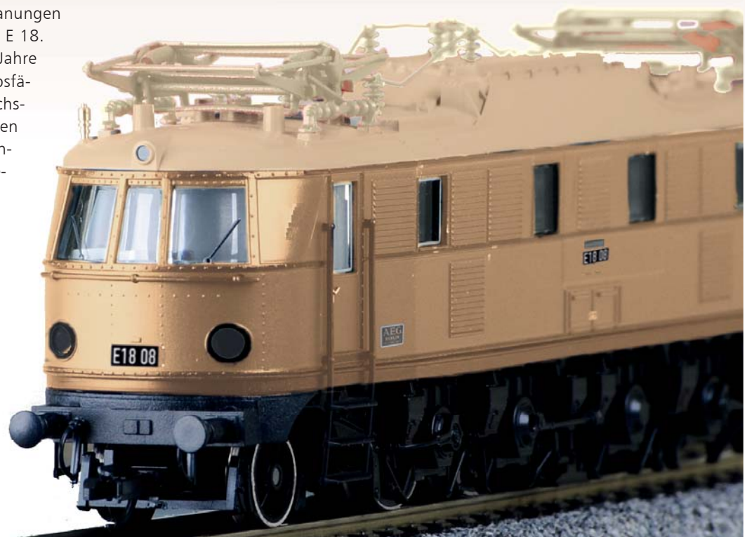
Abb. zeigen Handmuster

Oktober 1984 bei den Feierlichkeiten zum Jubiläum im Bw München der Öffentlichkeit präsentiert. In genau diesem Aussehen wird nun das neue Club-Exklusivmodell erscheinen. Erst später erhielt die Maschine im Vorbild dann auf diesem Grundierungsanstrich die spätere hellgraue Fotoackierung (Preis: 165,00 EUR).