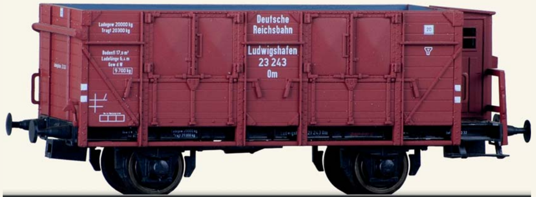
Abb. zeigt H0-Modell

schlag B und D einfach ideal. Somit wären meiner Meinung nach alle Mitglieder sehr gut bedient.“ Wir werden also künftig bei der Modellauswahl diesem neuen Weg folgen. Natürlich ist für uns die Attraktivität des Jahresmodells dabei ein ganz besonderes Kriterium. Erfreut werden Sie feststellen, dass wir für Ihr nächstes Jahresmodell sogar eine Formneuheit herausbringen werden! Und zwar eine, die auch in möglichen anderen Varianten exklusiv unse-