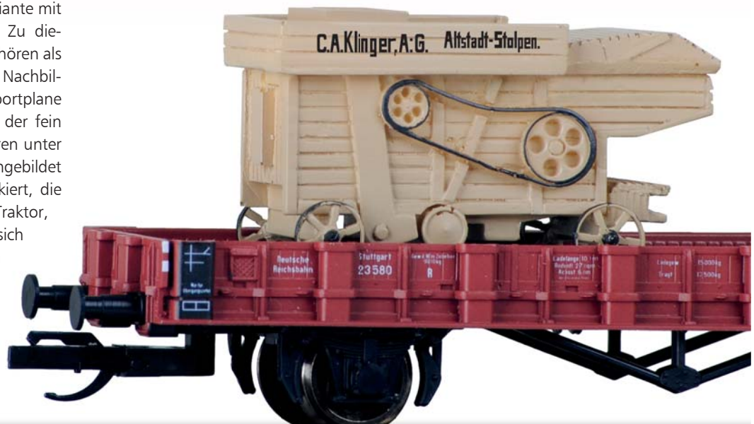
Abb. zeigen Handmuster