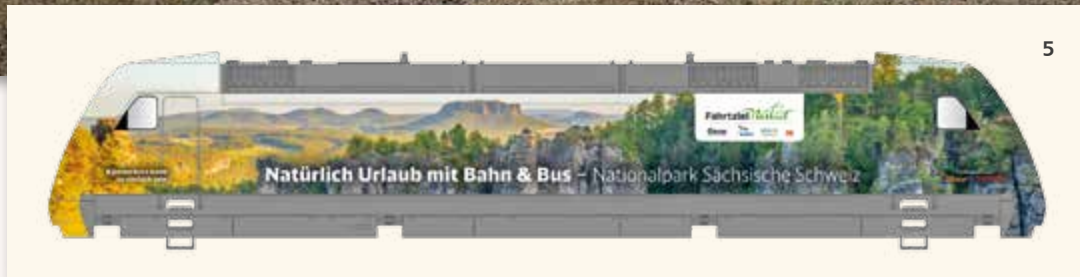
Abb. 5: Skizze einer der beiden Seiten der Ellok BR 101 "Fahrtziel Natur", Art. 02321 (mit freundlicher Unterstützung der DB Fernverkehr AG, Fahrtziel Natur und der Modelleisenbahn GmbH). Während auf der hier gezeigten Seite der Nationalpark Sächsische Schweiz zu sehen ist, zeigt die andere Seite Motive des Nationalparkes Hohe Tauern.

1980er Jahre als Versuchsträger. Dieser Betriebszustand ist die Basis für unser neues TT-Modell. Aktuell befindet sich die 182 001 im DB Museum Koblenz, wo sie bereits 2013 gemäß ihres Farbkonzeptes der 1980er Jahre optisch aufgearbeitet wurde.