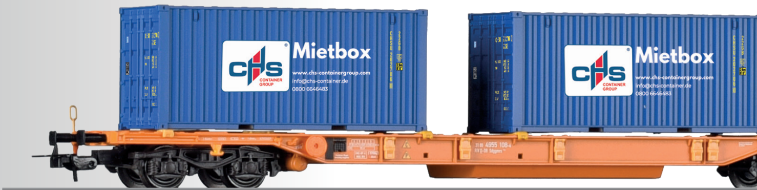
FORMNEUHEIT: Doppeltragwagen Sdggmrs 744 der DB AG, beladen mit vier Containern „CHS Container Handel GmbH“ NEW: Container Car Sdggmrs 744 of the DB AG with four container “CHS Container Handel GmbH”