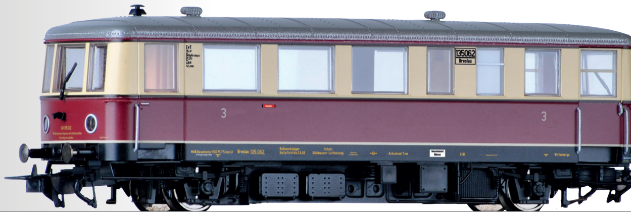
Triebwagen CVT 135 mit Beiwagen CPostv-36 der DRG Railbus class CVT 135 with trailer car CPostv-36 of the DRG