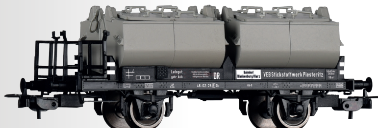
Kalkkübelwagn Ok der DR Lime transport car Ok of the DR