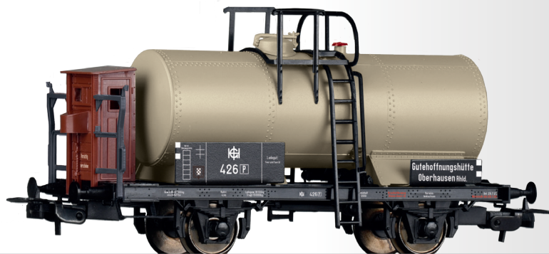
Kesselwagen der Gutehoffnungshütte Oberhausen Tank car of the Gutehoffnungshütte Oberhausen