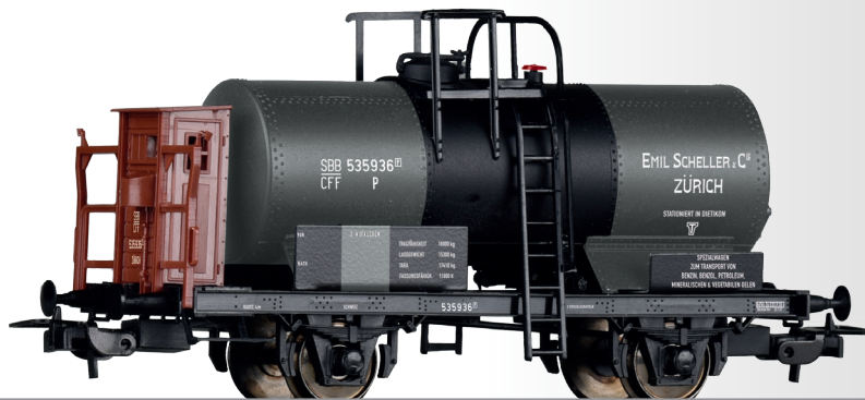
Kesselwagen „Emil Scheller & Cie., Zürich“, eingestellt bei den SBB Tank car „Emil Scheller & Cie., Zürich“ of the SBB