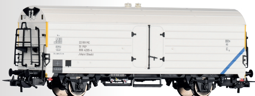
Kühlwagen Ibchqs der PKP Refrigerator car Ibchqs of the PKP