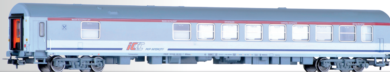
Speisewagen WRdmu der PKP Intercity Dining car WRdmu of the PKP Intercity