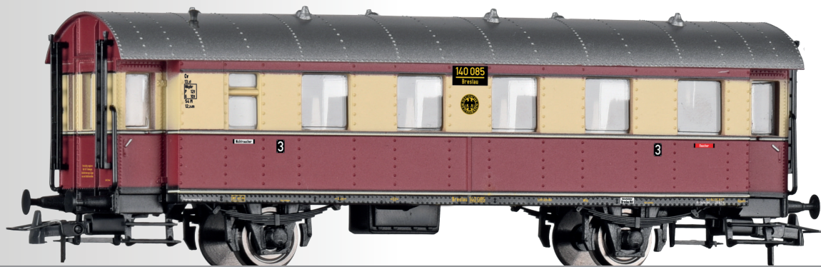
Beiwagen Cv-33 der DRG Trailer car Cv-33 of the DRG