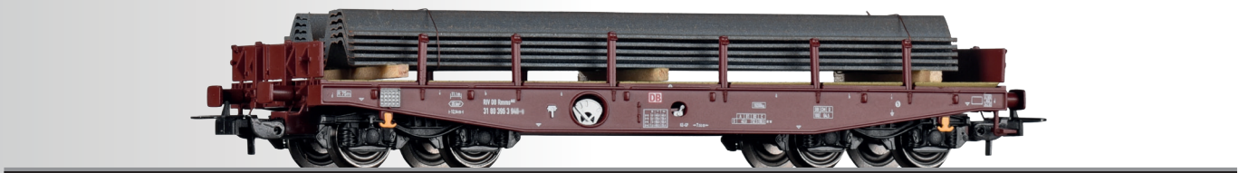
Schwerlastwagen Rmms 662 der DB AG, beladen mit Spundwänden Flat car Rmms 662 of the DB AG with load