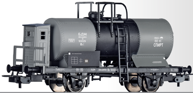
Kesselwagen Rpf der BDZ Tank car Rpf of the BDZ