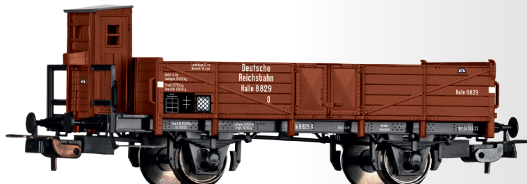
Offener Güterwagen O Halle der DRG Open car O Halle of the DRG