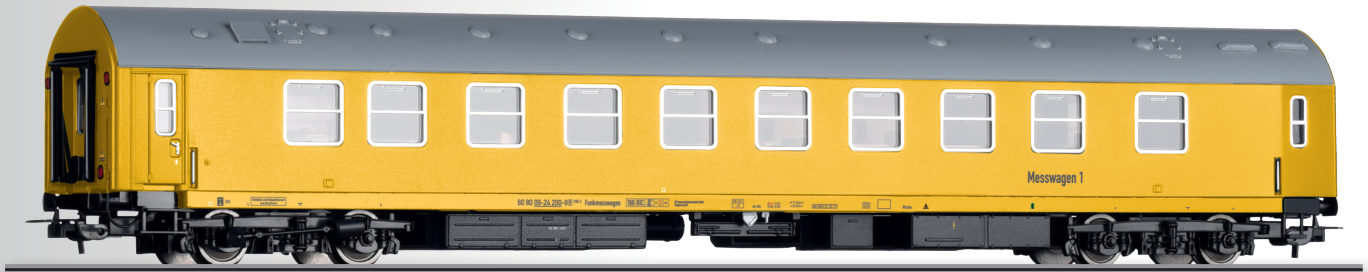
Funkmesswagen 296.3 der DB Kommunikationstechnik GmbH Radiomeasuring car 296.3 of the DB Kommunikationstechnik GmbH