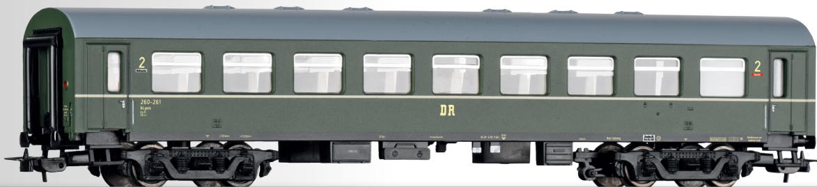
Reisezugwagen 2. Klasse B4gmle der DR 2nd class passenger coach B4gmle of the DR