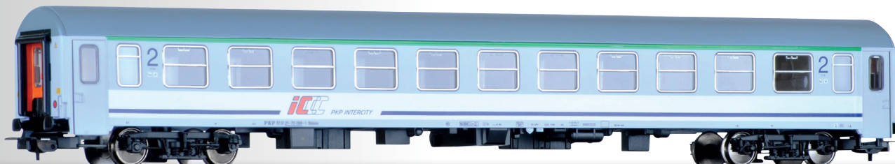
Reisezugwagen 2. Klasse Bdmu der PKP Intercity 2nd class passenger coach Bdmu of the PKP Intercity