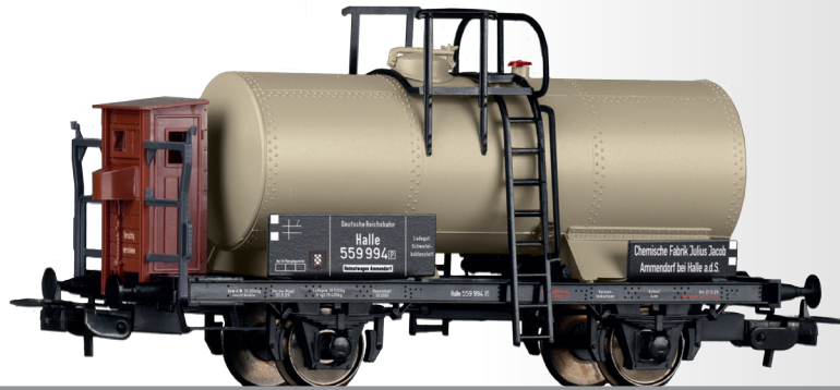
Kesselwagen „Chem. Fabrik Julius Jacob, Ammendorf“, eingestellt bei der DRG Tank car “Chem. Fabrik Julius Jacob, Ammendorf” of the DRG