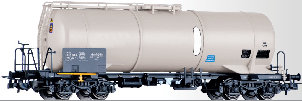
Kesselwagen Zas der Unipetrol Doprava s.r.o. (CZ) Tank car Zas of the Unipetrol Doprava s.r.o. (CZ)