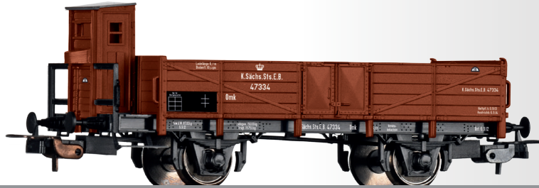
Offener Güterwagen Omk der K.Sächs.Sts.E.B. Open car Omk of the K.Sächs.Sts.E.B.